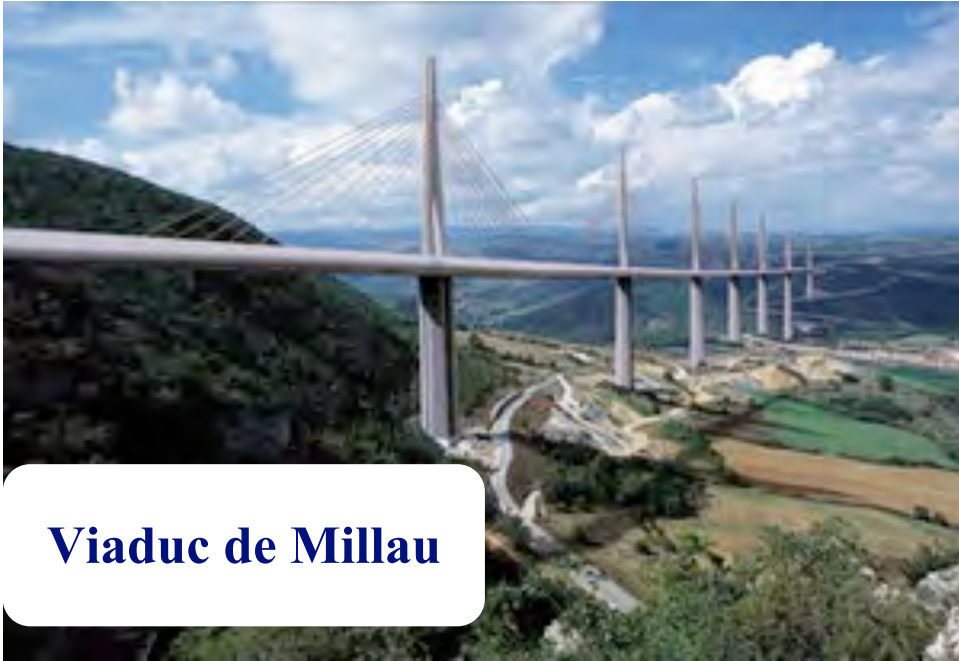
Viaduc de Millau